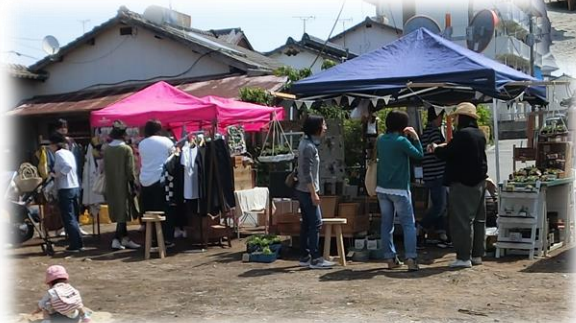
前回(4月)イベント時の写真