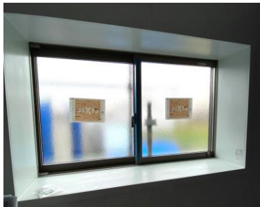
→ お風呂 after